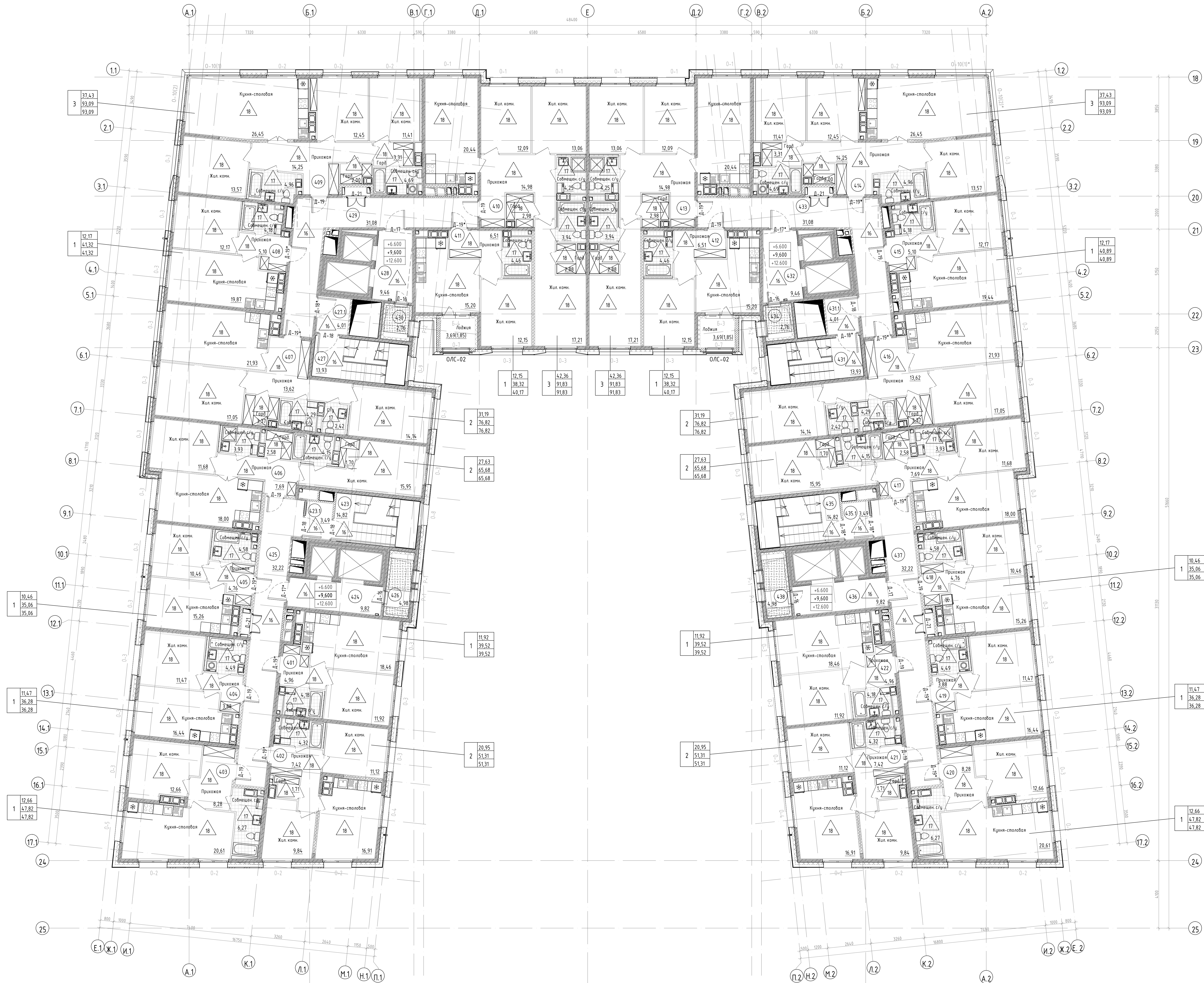
Отделочный план 3-5-го этажей ( 1 : 100)